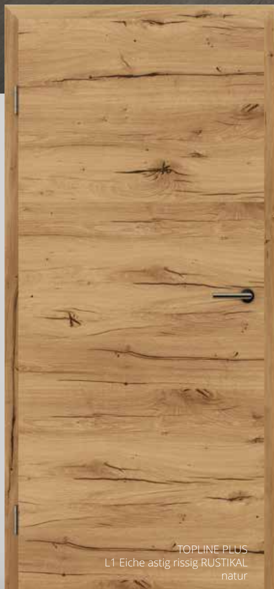
TOPLINE PLUS L1 Eiche astig rissig RUSTIKAL natur