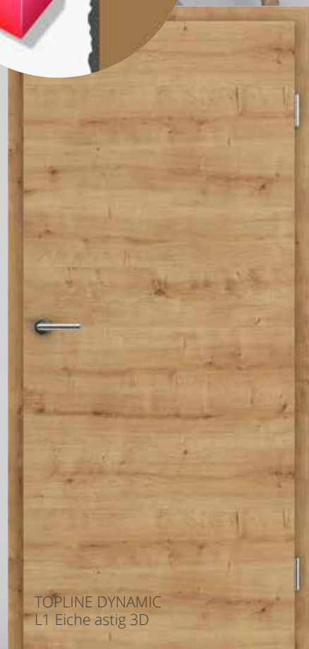
TOPLINE DYNAMIC L1 Eiche astig 3D