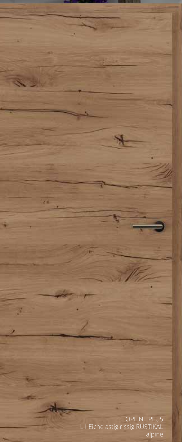
TOPLINE PLUS L1 Eiche astig rissig RUSTIKAL alpine

RUSTIKAL natur ist in helleren Farbtönen vorhanden und harmoniert sehr gut mit verschiedenen Parketten und anderen Bodenbelägen, die dem Raum ein wenig Rauheit und ein einfaches Aussehen verleihen. Wenn Sie in Ihrem Zuhause ein natürliches Aussehen möchten, ist dieser definitiv die richtige Wahl!