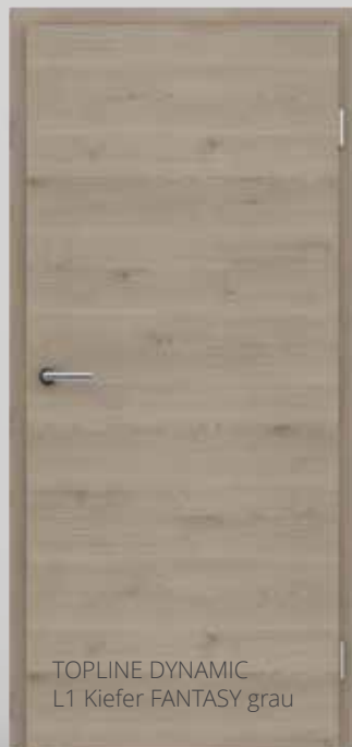
TOPLINE DYNAMIC L1 Kiefer FANTASY grau