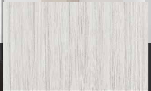
TOPLINE Palisander weiß