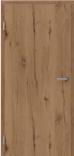
TOPLINE PLUS Eiche astig rissig RUSTIKAL alpine

AUCH IN LÄNGSLAUFENDER STRUKTUR ERHÄLTLICH