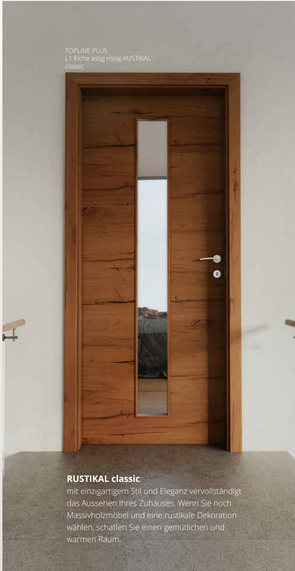
TOPLINE PLUS L1 Eiche astig rissig RUSTIKAL classic