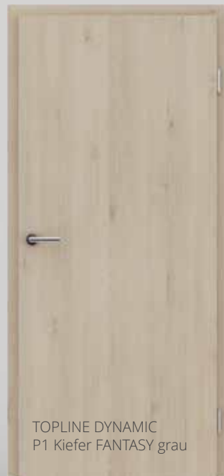
TOPLINE DYNAMIC P1 Kiefer FANTASY grau