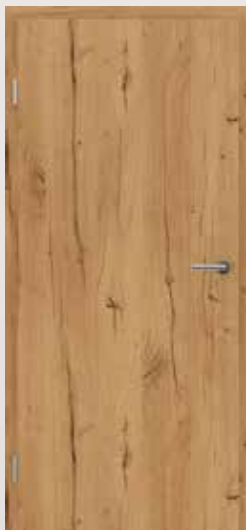
TOPLINE PLUS Eiche astig rissig RUSTIKAL natur