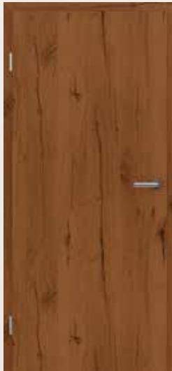
TOPLINE PLUS Eiche astig rissig RUSTIKAL classic