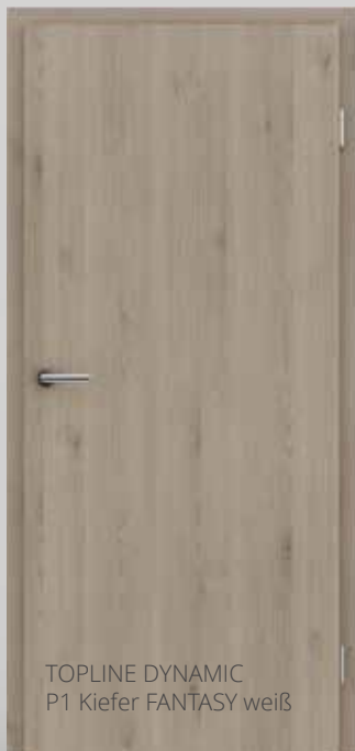
TOPLINE DYNAMIC P1 Kiefer FANTASY weiß