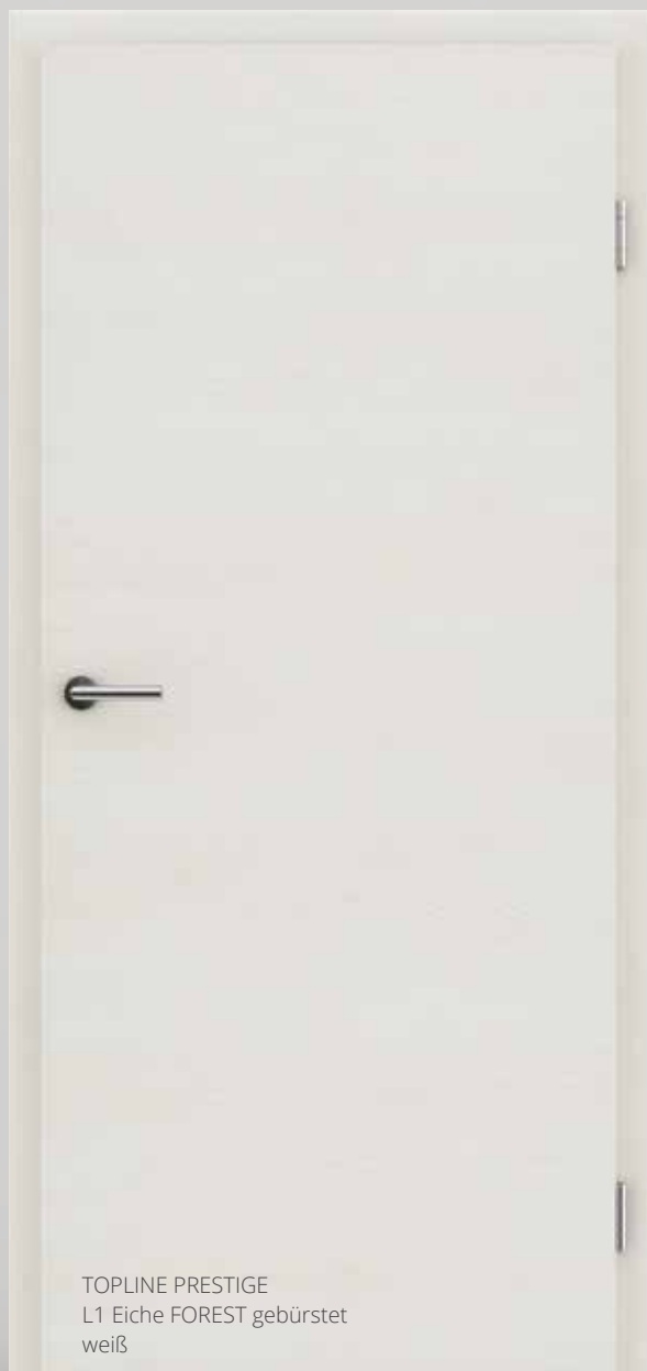
TOPLINE PRESTIGE L1 Eiche FOREST gebürstet weiß

Die Oberfläche mit synchronisierten Poren für eine echte MASSIVHOLZ-Optik.