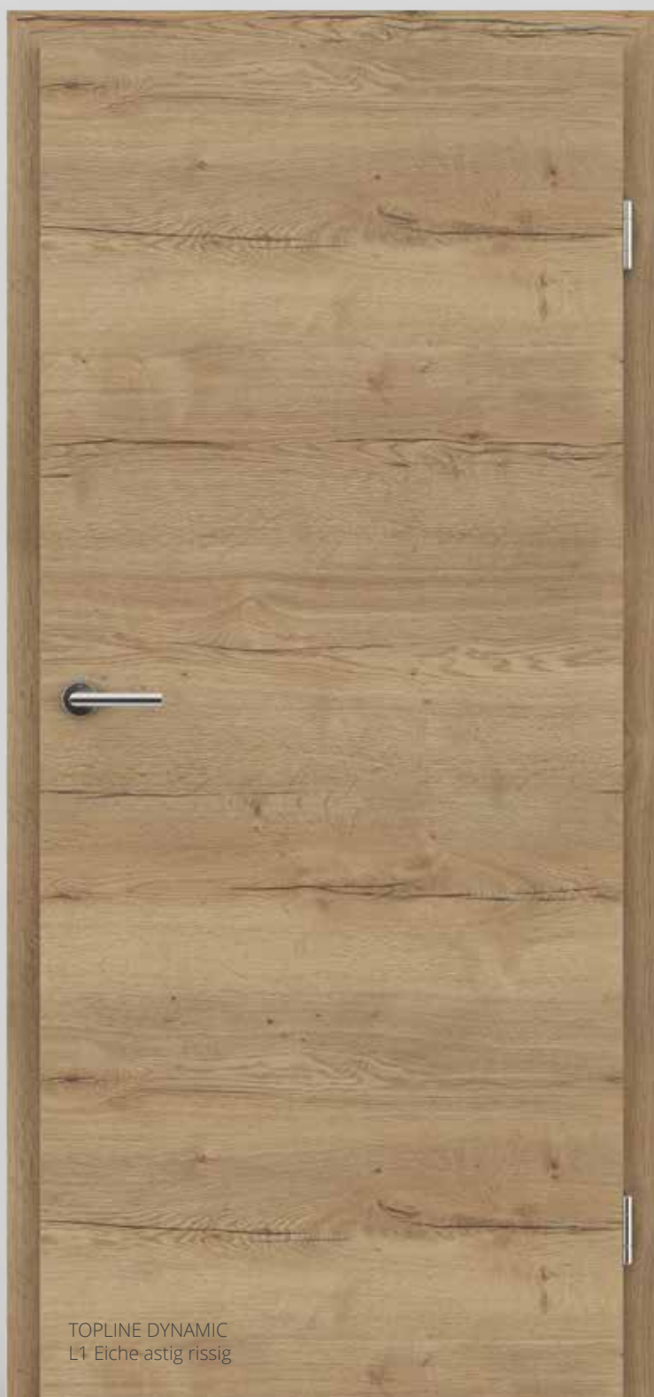
TOPLINE DYNAMIC L1 Eiche astig rissig