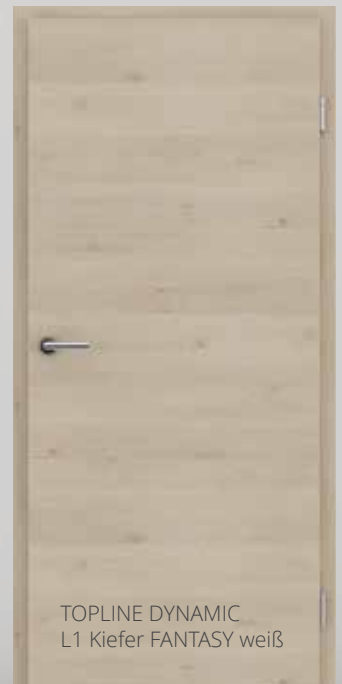
TOPLINE DYNAMIC L1 Kiefer FANTASY weiß