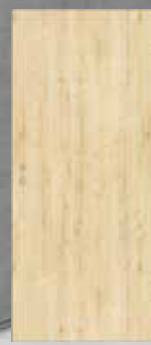
Modell P1 Querlaufende Struktur