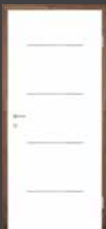
T2 EDELSTAHL DESIGNLEISTEN