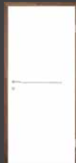
T16 EDELSTAHL DESIGNLEISTEN