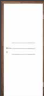
T4 EDELSTAHL DESIGNLEISTEN