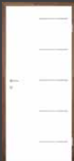
T17 EDELSTAHL DESIGNLEISTEN