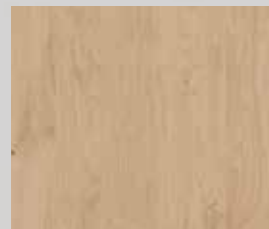
Eiche astig matt Effekt lackiert gebürstet