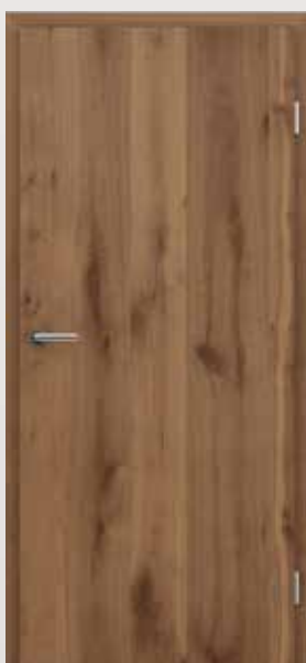
GREENLINE PRESTIGE Alteiche natur geölt