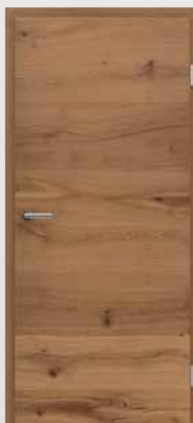
VIVACELINE / F4 PRESTIGE Alteiche natur geölt