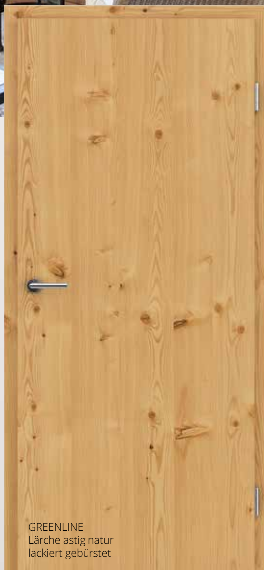
GREENLINE Lärche astig natur lackiert gebürstet

LÄRCHE ist unser einziger Nadelbaum, der im Winter seine Nadeln nicht behält. Ein Spaziergang durch den Lärchenwald ist bestimmt was Besonderes. Weil die Baumkronen viel Licht durchlassen, ist der Wald sehr hell. So passen auch furnierte Lärchentüren schön in helle und modern ausgestattete Räume. Das Lärchenholz ist dicht, schwer und robust, deswegen kann man daraus Produkte mit garantierter Widerstandsfähigkeit fertigen.