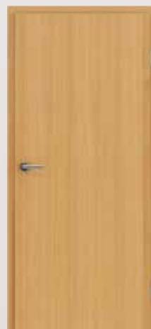
GREENLINE Lärche natur lackiert gebürstet