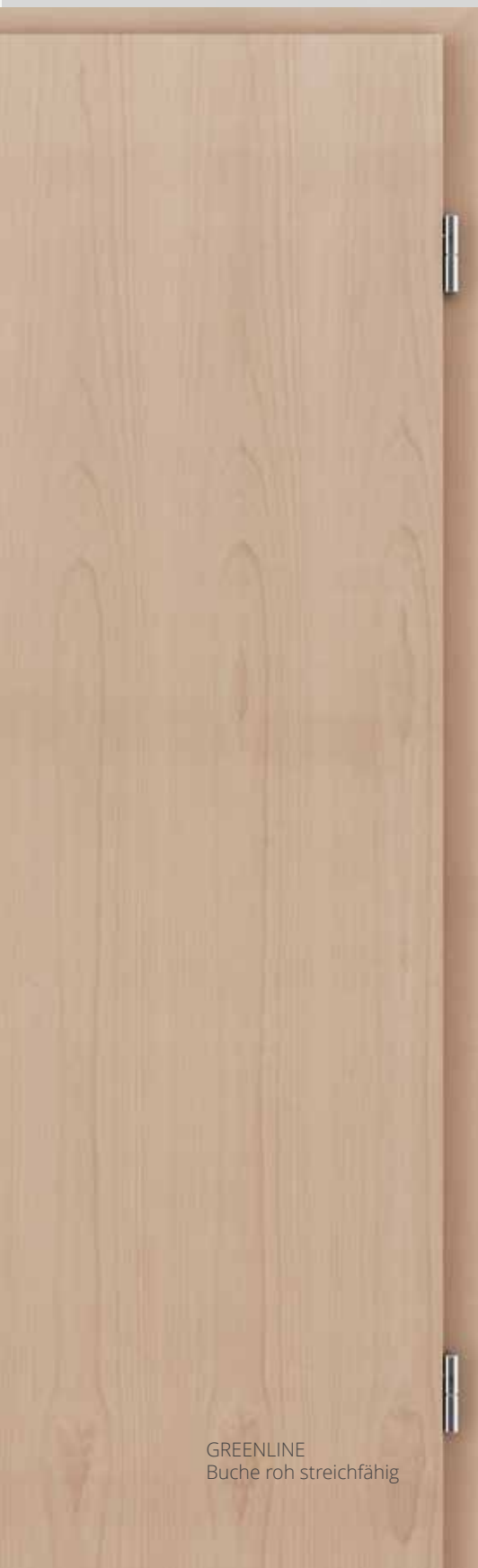
GREENLINE Buche roh streichfähig

Eine abwechslungsreiche Oberfläche aus zusammengesetztem Furnier bietet eine bunte Auswahl an Farben und Mustern.