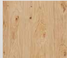
Eiche astig natur lackiert gebürstet