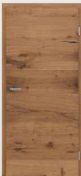
VIVACELINE / F4 PRESTIGE Alteiche matt lackiert