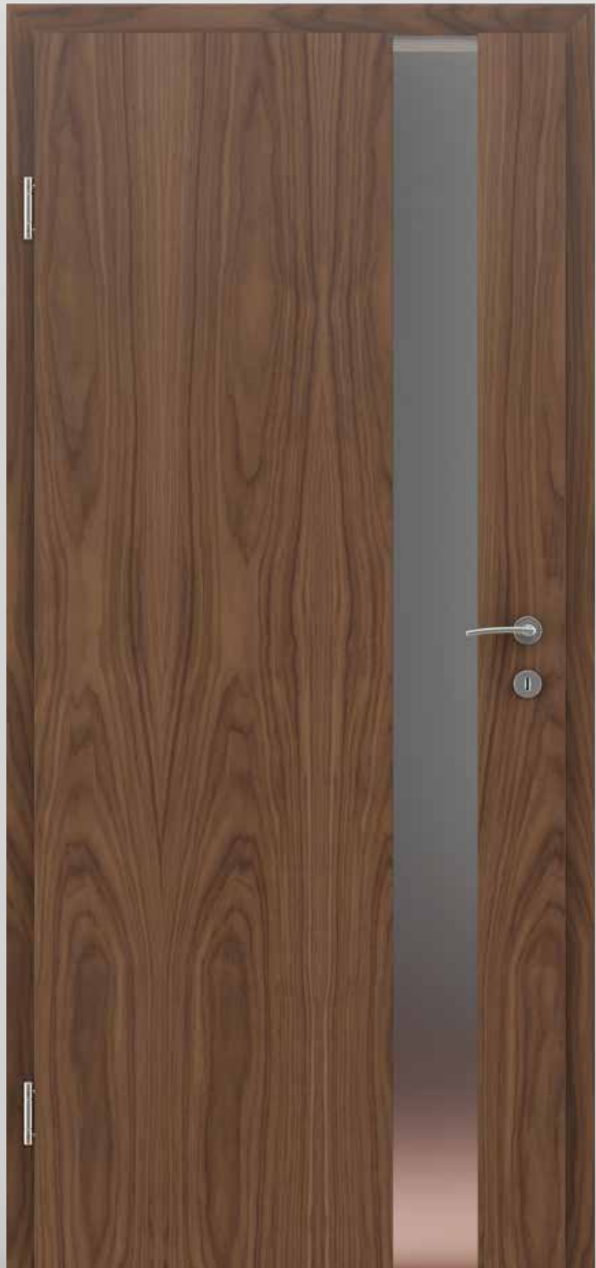
GREENLINE Nussbaum Modell LIFEline PN2

Setzen Sie auf Ursprünglichkeit. Naturliebhaber schwören auf beruhigende Farben und Formen, die auch Sie von ihrer Qualität überzeugen werden. Die einheitliche Oberflächenstruktur eignet sich auch für Modelle mit Aussparungen.