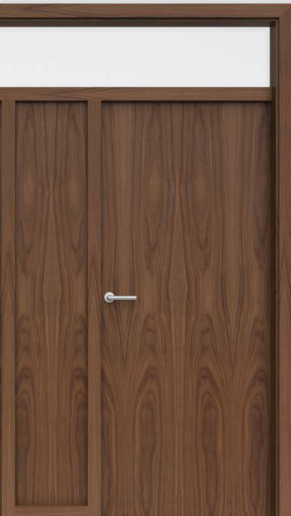
GREENLINE Nussbaum Modell DIVIDeline mit mittlerer Füllung und Oberlicht