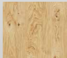
Eiche astig geölt gebürstet