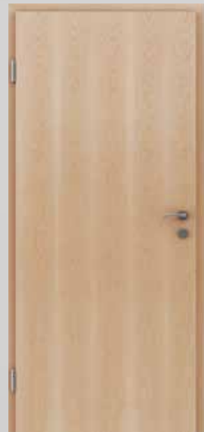
GREENLINE Erle getönt