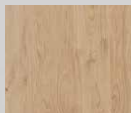
Eiche astig matt Effekt lackiert